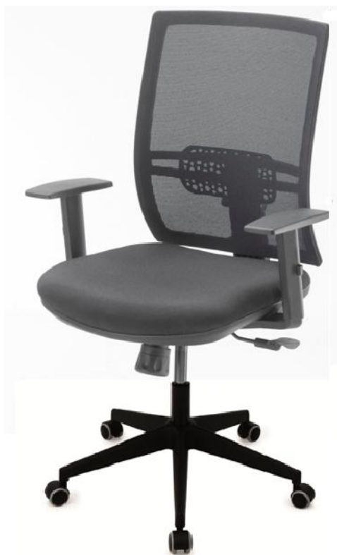
Estándar + opción brazos FRITZ