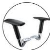
Brazos opción GULLIVER. Brazos regulables 2D cromados.