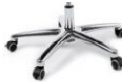
Base opción aluminio pulido