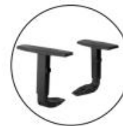
Brazos opción FRITZ. Brazos regulables en altura negros.