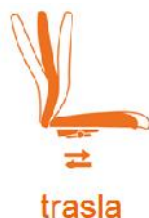
Mecanismo de traslación de asiento