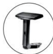
Brazos opción MAMBO. Brazos regulables 2D negros.