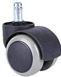
Rueda estándar de rodadura blanda de Ø 50 mm.