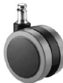
Opción rueda de rodadura blanda de Ø 65 mm.