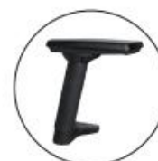
Brazos opción STAR. Brazos regulables 3D negros.