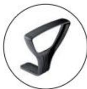
Brazos opción GOLF. Brazos fijos poliamida negros.