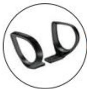
Brazos opción JACK. Brazos fijos poliamida negros.