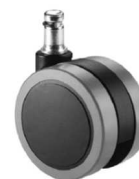
Juego de ruedas (5) de rodadura blanda de Ø65 mm.