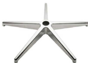
Base giratoria de aluminio pulido.