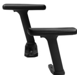
Brazos 3D/4D. 3D Regulables en altura, profundidad y giro. 4D Regulable en altura, profundidad, giro y ancho entre brazos.