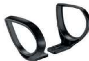
Brazos JACK. Fijos. Color negro.