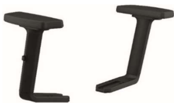
Brazos 1D/2D. 1D Regulables en altura. 2D Regulable en altura y profundidad. Color negro.