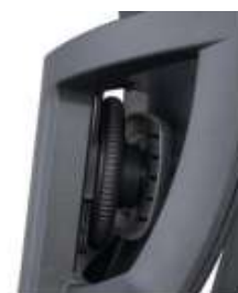
Apoya lumbar regulable 2D.