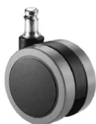
Juego de ruedas (5) de rodadura blanda de Ø65 mm.