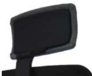
Apoya cabezas regulable tapizado.