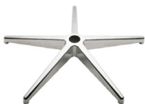
Base giratoria de aluminio pulido.