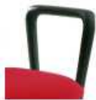
Pareja de brazos en polipropileno negro modelo SR.