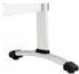
Juego de patas en tubo de acero con niveladores acabado cromado modelo 90C.