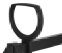
Pareja de brazos en polipropileno negro modelo APOLO.