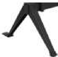
Juego de patas en tubo de acero con niveladores acabado epoxi negro modelo 200N.