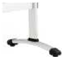
Juego de patas en tubo de acero con niveladores acabado cromado modelo 90C.