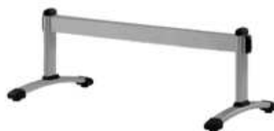
Patas + travesaño acabado gris aluminio.