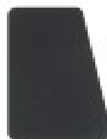
Pala rectangular. (solo a drcha.)