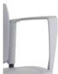
Pareja de brazos en varios colores.