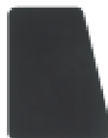
Pala rectangular. (Solo DCHA.).