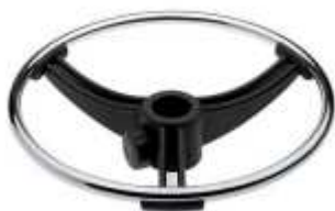
Aro reposapiés cromado con ajuste de altura ROUND.