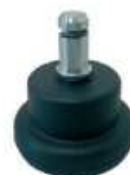
Juego de topes (5) antideslizantes de nylon negro.