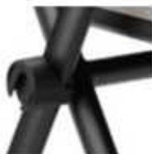
Pieza de unión simple.