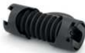
Pieza de unión para estructura con brazos.