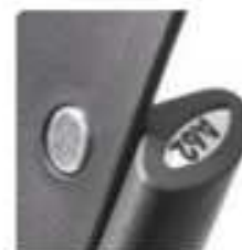
Adhesivo numérico de fila y asiento.