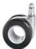
Opción (Ø 65 mm. HUECAS)