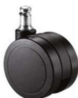
Opción (Ø 65 mm. HUECAS)