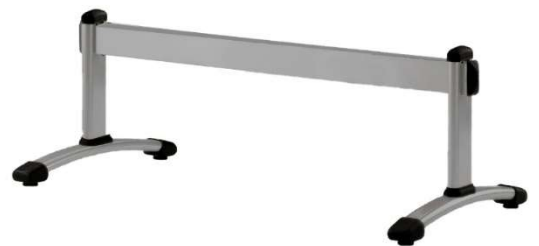
Patas + travesaño acabado gris aluminio