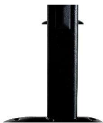
Juego de patas (2) para bancada en tubo de acero con niveladores acabado epoxi negro modelo ANCLA.