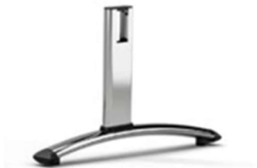
Juego de patas (2) para bancada en tubo de acero con niveladores acabado cromado modelo 90C.