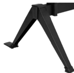
Juego de patas (2) para bancada en tubo de acero con niveladores. Acabado epoxi negro modelo 200N.